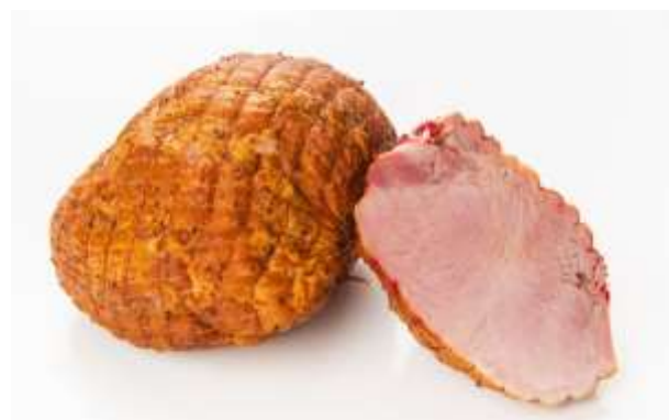
свинина нежирная запеченая