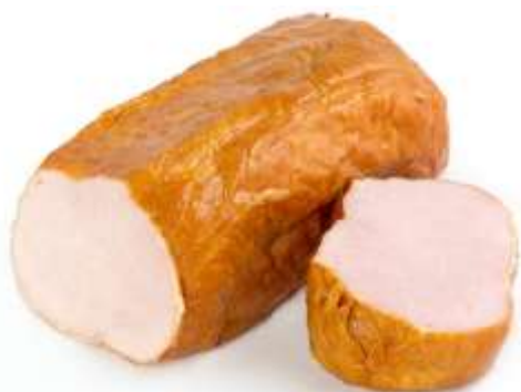
балык свиной запеченый