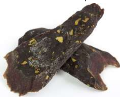
балык говяжий сыровяленный, специи